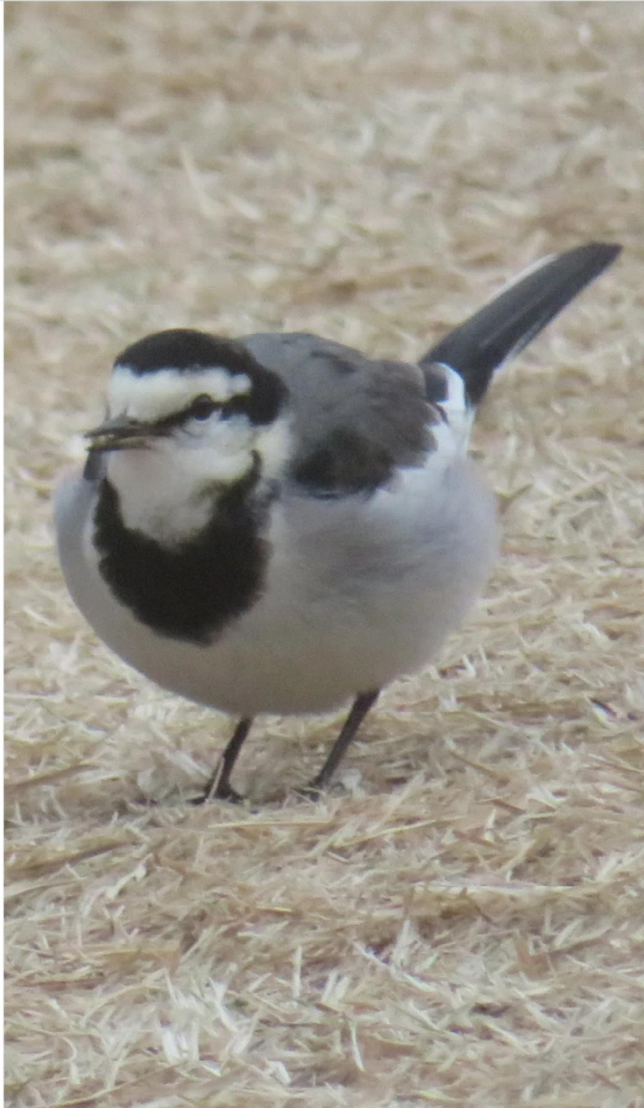
レイ セキ 鳩の鶴臨 本日1/27明治神宮 創元に本