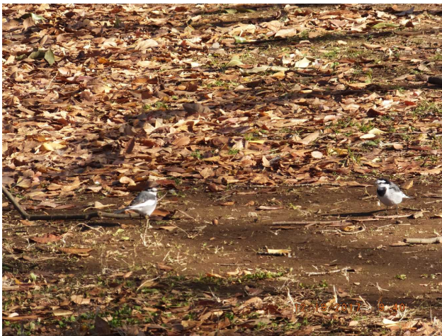
せきれい 「万葉の鶴鴿とは」代々木公園 2017年12月19日 09:40am

「 一条同仁 」: 2019.02.11 pdf 2018.10.14pdf 2018.06.22 子工