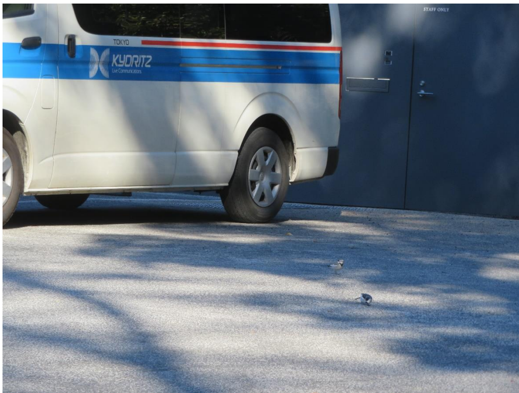
せき れい 鶴と鴿の婚臨：親臨 明治神宮ミュージアム裏道 令和二年 12 月 16 日 10:19