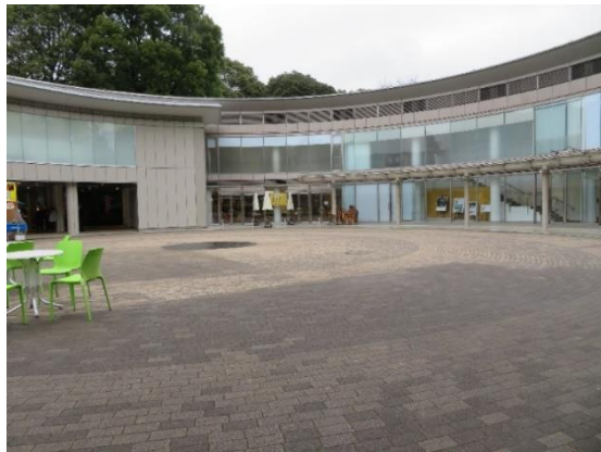
明治神宮 杜テラス円庭