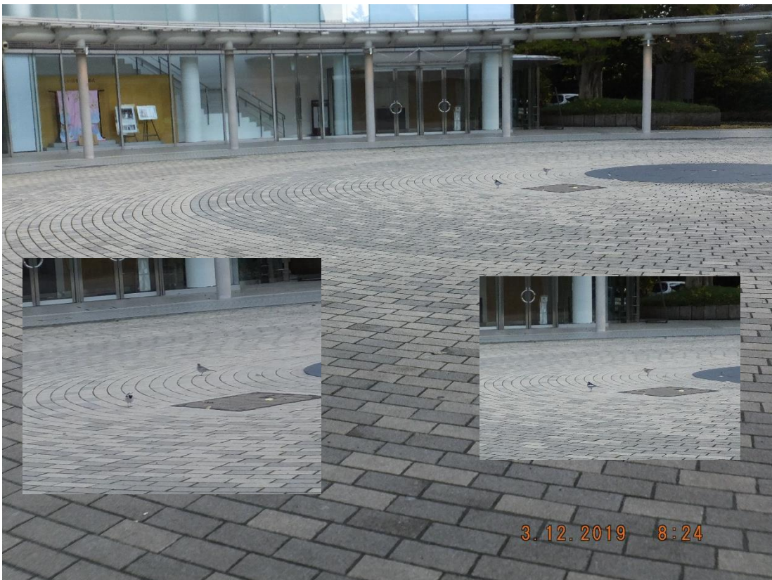
「 せき 親 鶴と鶴の婚臨」 令和元年 12 月 3 日(火)08:24 明治神宮 杜のテラス円庭