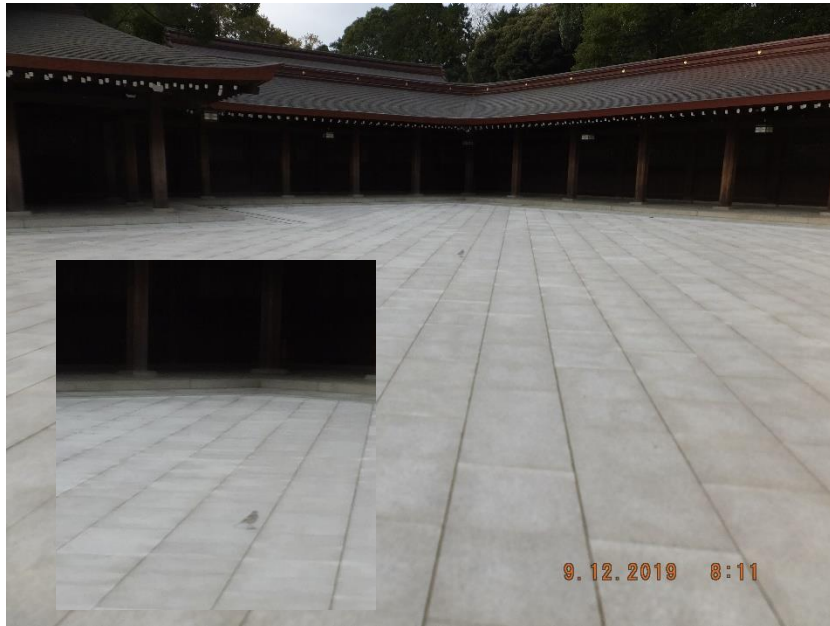
敢えてかしく鳥の目 令和九条 せき れい 「鳥瞰傳育」の前仁未踏：鶴か鴿 令和元年 12 月 9 日 12:35 明治神宮：南鳥居入口